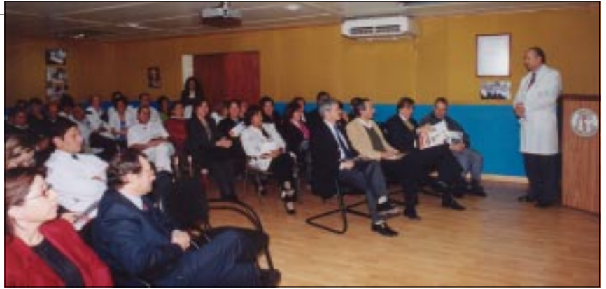
Asistentes escuchan atentamente la Cuenta Pública del Instituto Traumatológico

Destacó los excelentes resultados obtenidos con la modalidad de cupos de resolución quirúrgica por cada equipo, que la Unidad de Emergencia cuenta con tres médicos staff por turno más anestesiólogo y equipos por patología funcionando mañana y tarde. Luego mencionó que las intervenciones quirúrgicas aumentaron en 7.9%, los egresos hospitalarios en 3.1%, el total de días camas ejecutados un 11%, que el índice ocupacional