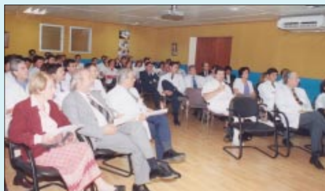
Autoridades e invitados, escuchan atentamente la exposición del Profesor Merino.

Arte y de América Latina: identidad y alteridad".