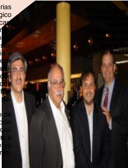
... del Dr. ... pa el ... y el ... de los ... borti ... sig ... naciendo”.

Allí, participará en un gran proyecto de trabajo permanente y sostenido en el tiempo, con todas las ramas del Club Deportivo de la UC. “Igual tengo sentimientos encontrados, contento porque me están dando la oportunidad de trabajar en lo que yo siempre había soñado en mi vida profesional y pena, porque en cuatro años que no es poco tiempo, siempre traté de hacer bien mi trabajo y de llevarme bien con todo el mundo. Pese a que uno tiene su genio y su manera de ser, no creo que nadie me esté odiando allá en este minuto o sea inmensamente feliz porque me haya ido”.