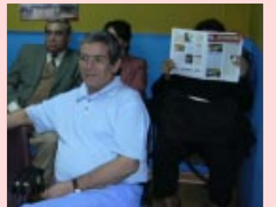
Misteriosa e incognita asistente a Cuenta Pública