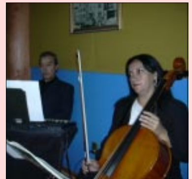
Intermedio musical de cuerdas.