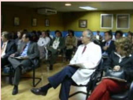
El auditorio escucha atentamente la presentación musical.