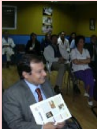
Logros y cifras alentadoras para sonreír.