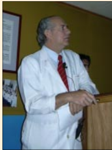
El director del Instituto Traumatológico en plena exposición.

L a presentación de la cuenta pública 2005, que incluyó una detallada visión de los índices del Instituto Traumatológico en su proyección a 20 años plazo, nos dejó con una sensación de que hemos dado lo mejor de nosotros en los últimos tiempos y que, efectivamente, nuestra meta es continuar con más ímpetu aún trabajando para continuar en un camino ascendente de para optimizar nuestra gestión en beneficio de nuestros pacientes y de los indicadores sanitarios de nuestro país.