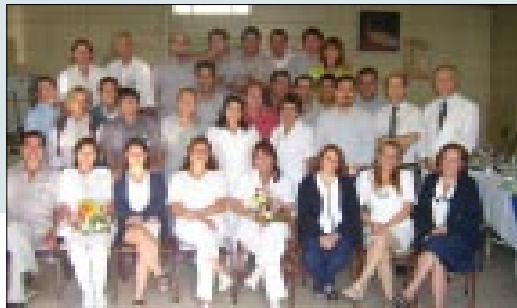
Los Auxiliares de Servicio del Instituto Traumatológico en pleno.