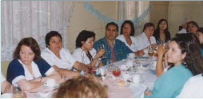
Celebración de los Técnicos Paramédicos