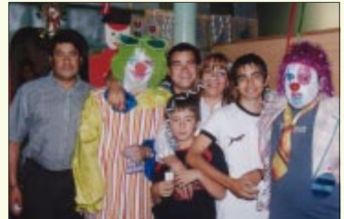
Grupo de asistentes

Esta iniciativa también incluye también el entusiasmo, la voluntad y la alegría de los funcionarios, quienes se disfrazan de payasos y de Viejo Pascuero, para dar vida cada fin de año a una hermosa Navidad.