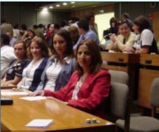
Funcionarios Instituto Traumatológico

En una ceremonia realizada en el Edificio Diego Portales y que contó con la presencia de las máximas autoridades del Ministerio de Salud, la Dirección del Servicio de Salud Metropolitano Occidente, distinguió a funcionarios y equipos de trabajo de sus distintos hospitales que se destacaron el año 2005 por su aporte y compromiso con la Reforma de Salud.