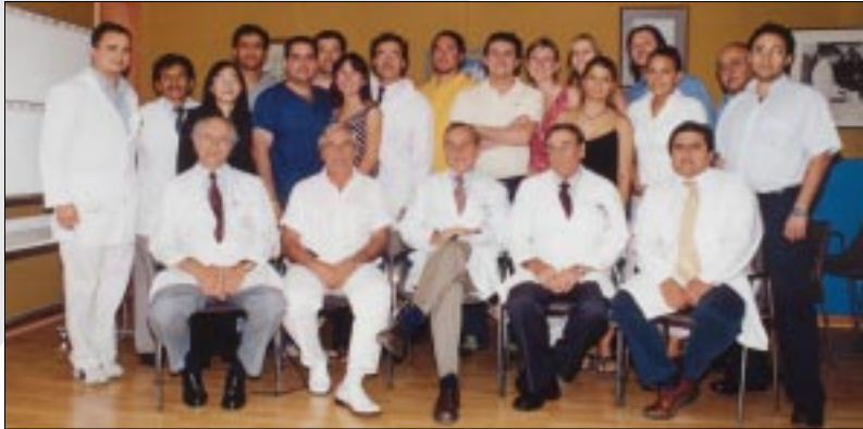
Alumnos, docentes y autoridades del Instituto Traumatológico participaron en la versión 2005 de esta jornada científica.