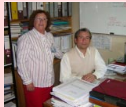
Servicios Generales: "Este reconocimiento que nos da mucha alegría y orgullo, pero también nos impone la responsabilidad para seguir trabajando igual y mejor"