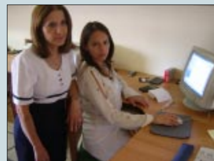
Unidad de Gestión, Calidad y Capacitación: "Si le va bien a la Unidad de Gestión nos va bien a todos y esa es una de las prioridades porque el Instituto merece ser un hospital auto-gestionado".