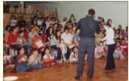
Los funcionarios junto a sus hijos disfrutaron del show de los mimos