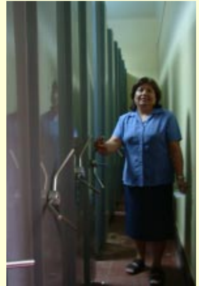
Anaqueles metálicos y móviles