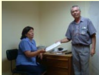
Sala especial para atención de público