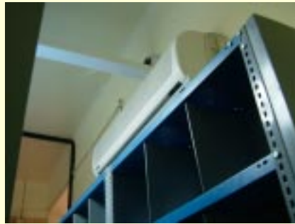
Sistema de aire acondicionado