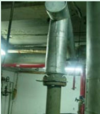
En este punto se instalará el by pass para la nueva red de calefacción para el quinto piso.

Con una red especial para entregar calefacción al quinto piso contará nuestro Instituto. Este proyecto, que busca manejar con más eficiencia este recurso, consiste en independizar del resto del edificio la calefacción del quinto piso que tiene cielo falso y techo de zinc que hace que la temperatura se pierda muy rápidamente, lo que obliga a destinar mayor cantidad de gas a este sector para mantener calefacionadas sus dependencias, entre ellas 13 salas de enfermos.