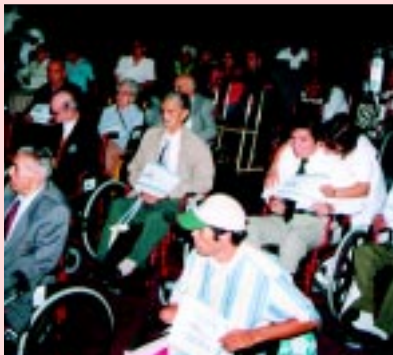
Pacientes del Instituto beneficiados con sillas de rueda

Un total de diez sillas de ruedas para pacientes de escasos recursos de nuestro Instituto, donó el Rotary Club de Santiago que acogió la iniciativa de ayuda humanitaria del traumatólogo chileno Dr. Francisco Soza a través de la Fundación que creó en 1988 en EE.UU, para ayudar a pacientes traumatológicos de escasos recursos.