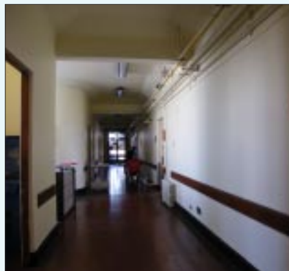
Pasillo cuarto piso