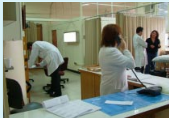
Servicio de Urgencia

Así este Servicio, ubicado en el primer piso del estable-