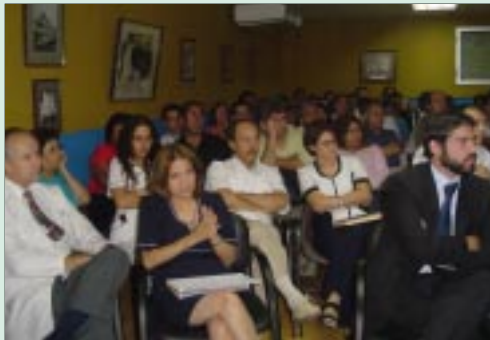
Equipo de salud de nuestro Instituto escucha atentamente la exposición sobre la Reforma Procesal Penal.

“En esta Reforma Procesal Penal, los médicos serán peritos, testigos y los ojos de los fiscales al momento de hacer su informe por escrito y luego cuando deban entregarlo verbalmente en los juicios orales públicosafortunadamente no llegan a más del 1%”, precisó el Dr. Cárcamo.