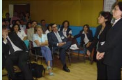
Fiscales del Ministerio Público imparten capacitación a equipo de salud del Instituto.

El equipo de salud de nuestro Instituto, conoció cuáles son los objetivos y metas de la nueva Reforma Procesal Penal, la estructura y funcionamiento del Ministerio Público y su interrelación con los médicos, el