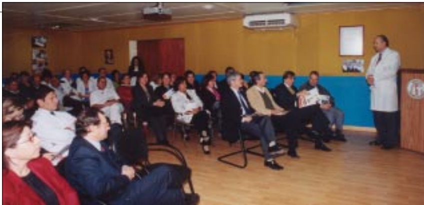
Asistentes escuchan atentamente la Cuenta Pública del Instituto Traumatológico

Destacó los excelentes resultados obtenidos con la modalidad de cupos de resolución quirúrgica por cada equipo, que la Unidad de Emergencia cuenta con tres médicos staff por turno más anestesiólogo y equipos por patología funcionando mañana y tarde. Luego mencionó que las intervenciones quirúrgicas aumentaron en 7.9%, los egresos hospitalarios en 3.1%, el total de días camas ejecutados un 11%, que el índice ocupacional