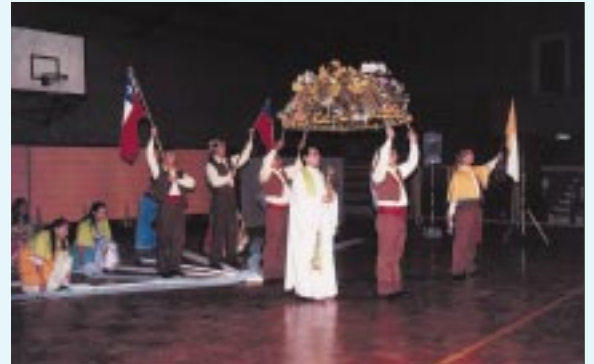
Ballet Folclórico de la Universidad de Santiago, presenta el cuadro "Cuasimodo".