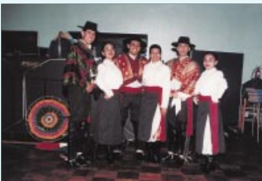
Integrantes del Ballet Folclórico de la Universidad de Santiago.