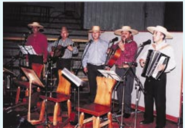
Actuación de integrantes del conjunto COFOTRA del Instituto Traumatológico.