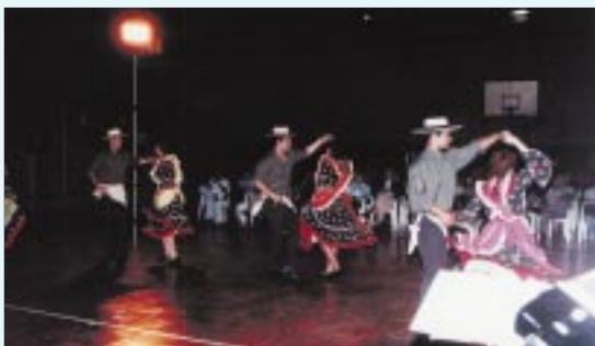
Conjunto COFOTRA presenta el cuadro "La Trilla".