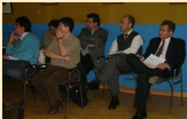
Asistentes al Consejo Técnico.