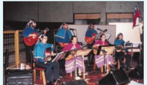
Actuación de conjunto de la USACH.